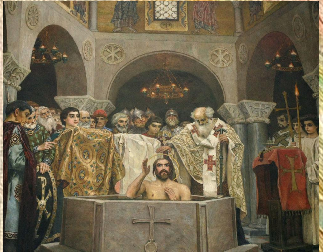
Крещение князя Владимира. 1885-1896