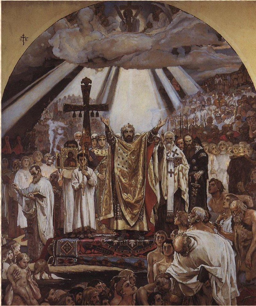
Крещение Руси. 1885-1896

В конце 1890-х годов всё более заметное место в творчестве Виктора Михайловича Васнецова занимает религиозная тема. Около одиннадцати лет художник расписывал огромный Владимирский собор в Киеве. Храм был украшен тематическими фресками: «Крещение Руси», «Крещение князя Владимира», «Христос Вседержитель» (купол), «Единородный сын Слово Божие», «Радость праведных о Господе».