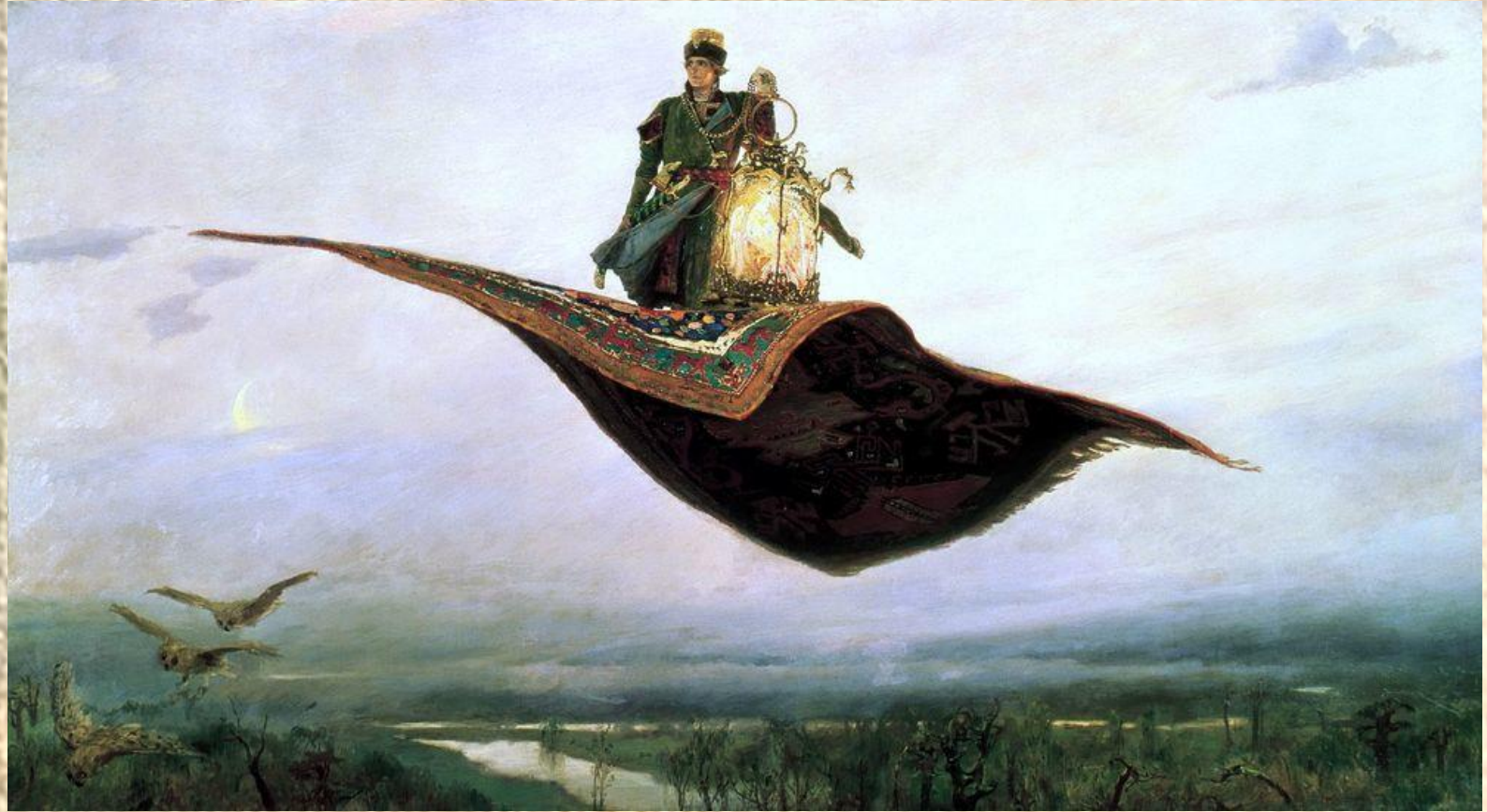
Ковер-самолет. 1880 год

Картина Васнецова «Иван-царевич на Сером Волке», несомненно, самое волшебное произведение русского изобразительного искусства. Вся картина наполнена неким загадочным мерцанием, чудом, самой сказкой.