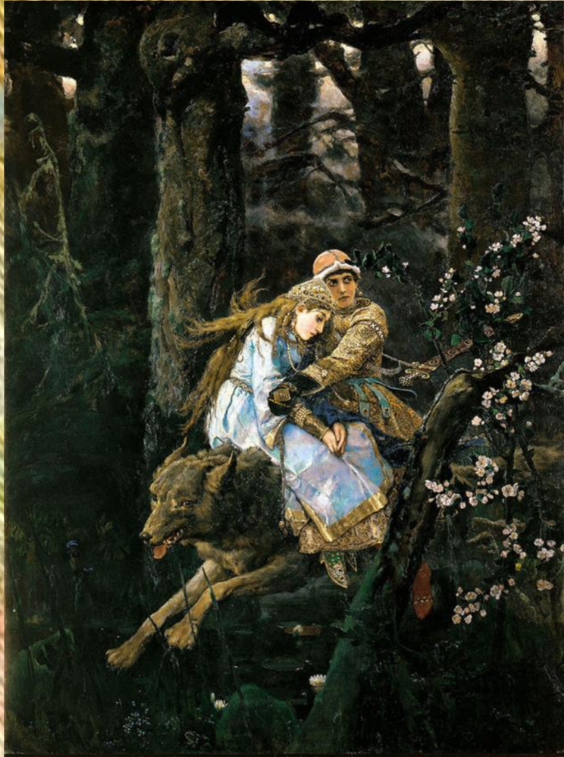
Иван-Царевич на сером волке. 1889 год

Для рабочего кабинета Саввы Ивановича Мамонтова была написана картина «Ковер-самолет».