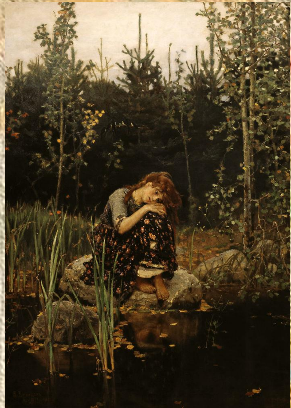
Аленушка. 1881 год

Одним из наиболее романтических и трогательных творений художника становится полотно «Аленушка», написанное в 1881 году. Образ картины сложился у Виктора Михайловича после встречи с крестьянской девочкой, поразившей его выражением «чисто русской печали». На полотне мы видим сидящую на берегу омута девушку. Она печально склонила голову, и ее грусти искренней и нежной внимлет природа. Васнецов раскрыл тончайшую связь между переживаниями человека и состоянием природы, ту же связь, что веками во всем великолепии передавалась в народной поэзии.