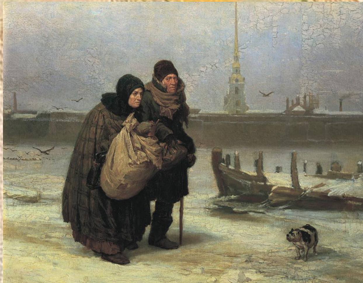
С квартиры на квартиру, 1876 год

Виктор Михайлович Васнецов – великий русский живописец, чье имя и картины известны каждому. Художественную ценность произведений Васнецова для русской культуры невозможно переоценить. Он был одним из первых, кто оживил на своих полотнах волшебный мир сказок, былин и русского фольклора. Он создал иллюстрации к произведениям Пушкина и Лермонтова, свыше десяти лет своей творческой жизни посвятил работе над росписями Владимирского собора в Киеве. Васнецов начал выставлять свои картины еще со времен обучения в Академии художеств в Петербурге, потом продолжил, присоединившись к выставкам художников-передвижников. Во время жизни в Петербурге Виктор Васнецов создавал полотна бытового жанра.