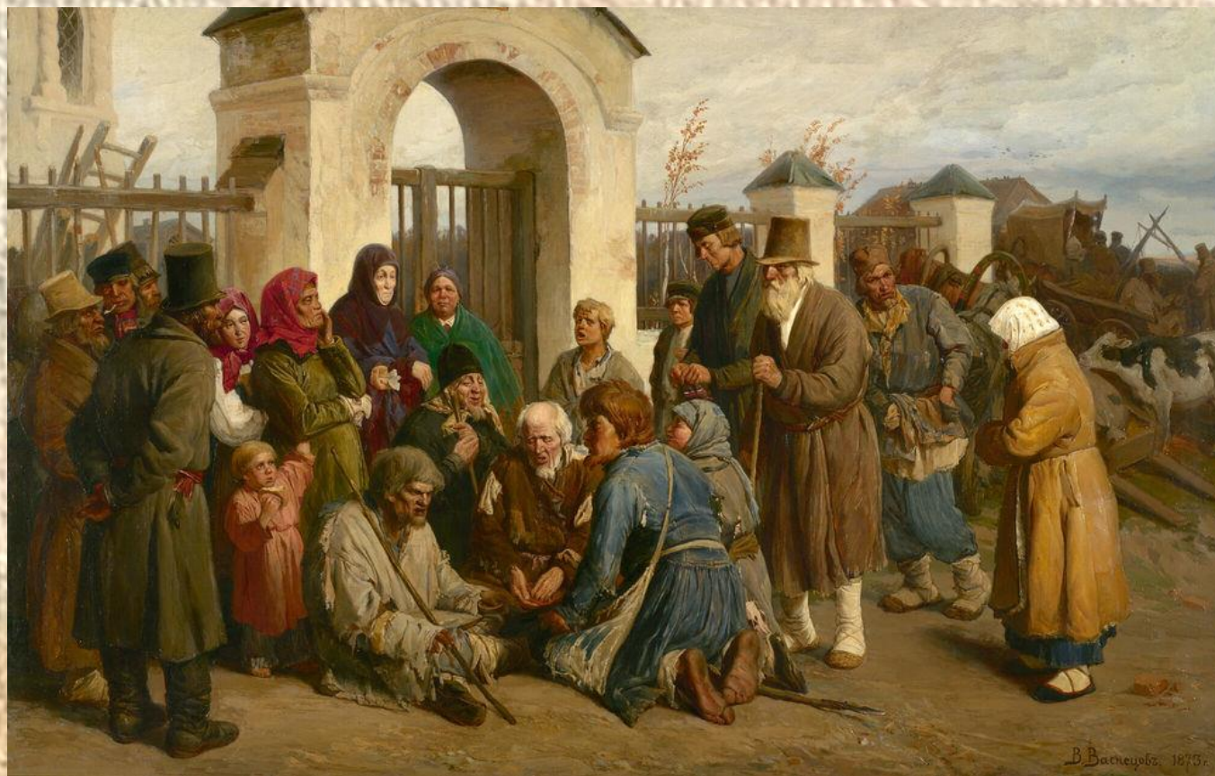
Нищие певцы (Богомольцы). 1873 год

Васнецов был одухотворен новой работой, ведь кому как не ему, выходцу из простого народа, прожившему все детство среди крестьян, известны тяготы такой жизни? Глядя на многофигурные композиции, так и ощущается вся горечь нищей жизни и поучительная правда, а типажи отображают высокое мастерство автора.