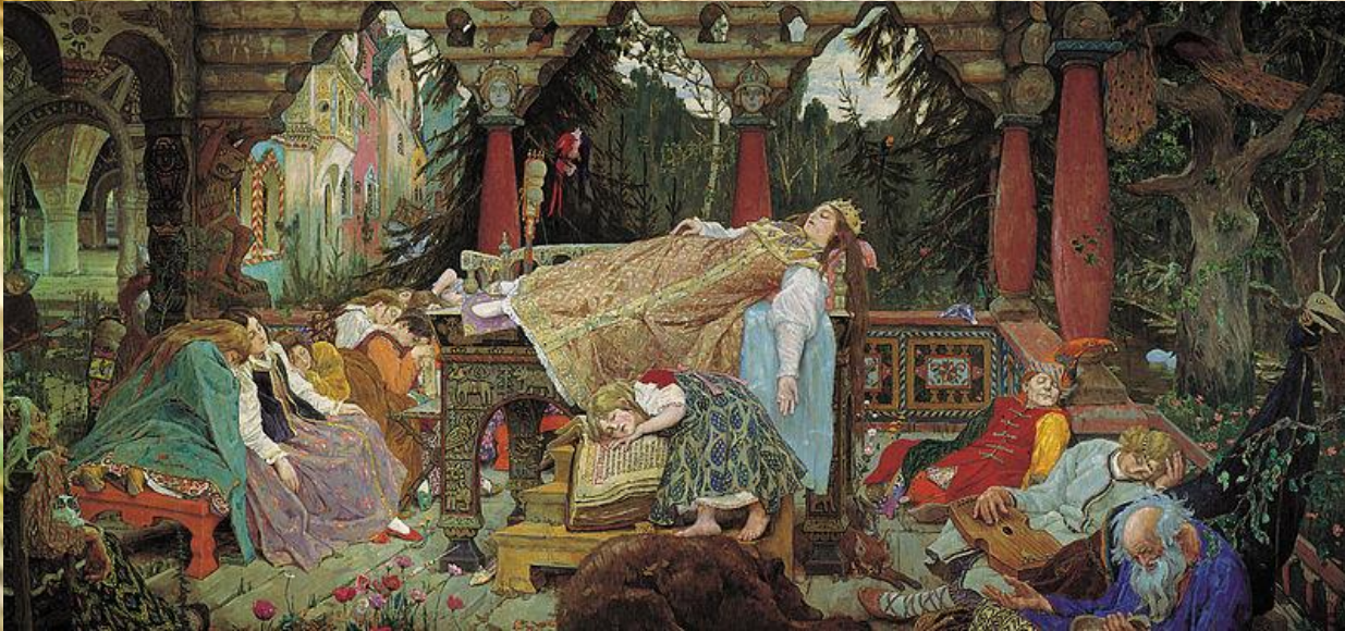
Спящая царевна, 1926 год

Художник говорил: «Нет на Руси для русского художника святее и плодотворнее дела, как украшение храма». Успех храмовой росписи Васнецова был огромный. Образы и сюжеты обрели популярность и их в дальнейшем стали использовать во многих строящихся церквях России. Но тема русского эпоса не покидала мастера до самой смерти.