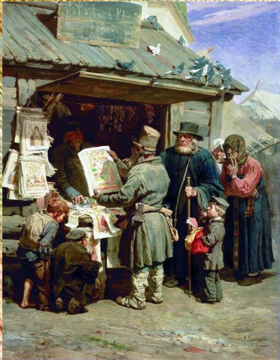
Книжная лавочка. 1876 год

Васнецов был одухотворен новой работой, ведь кому как не ему, выходцу из простого народа, прожившему все детство среди крестьян, известны тяготы такой жизни? Глядя на многофигурные композиции, так и ощущается вся горечь нищей жизни и поучительная правда, а типажи отображают высокое мастерство автора.