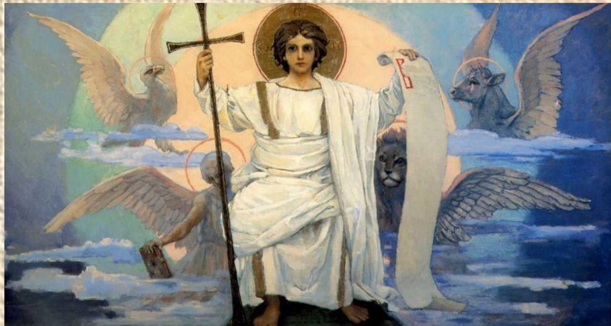
Единородный сын Слово Божие. 1885-1896