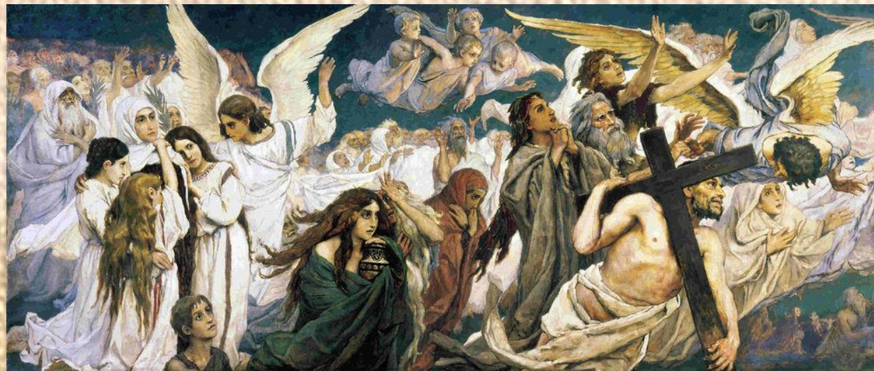
Радость праведных о Господе (левая часть триптиха). 1885-1896