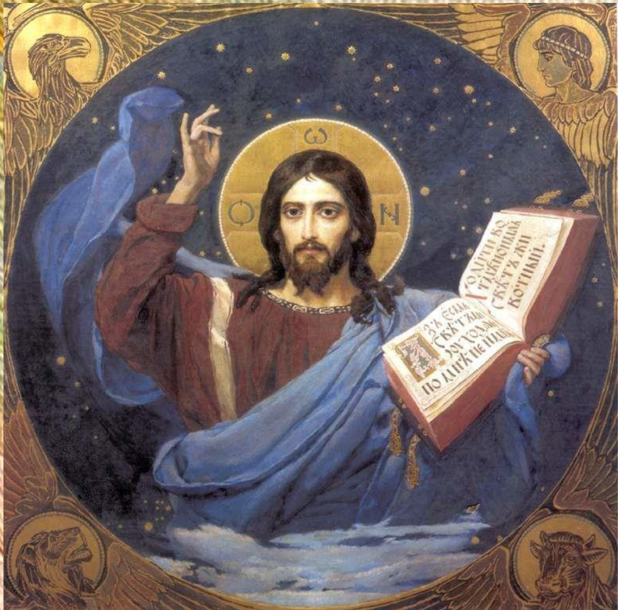
Христос Вседержитель. 1885-1896