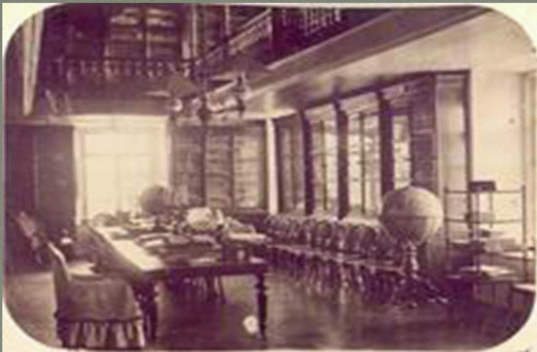
Дворец М.Д. Бутина. Библиотека

Домашний музей и библиотека (до 30 тыс. томов.)