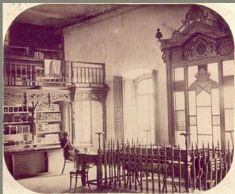
Дворец М.Д. Бутина. Магазин